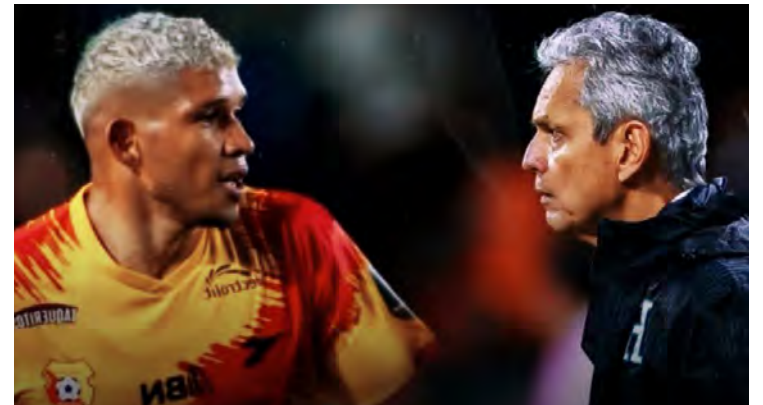
El defensor catracho confiesa que nunca ha hablado con Rueda.