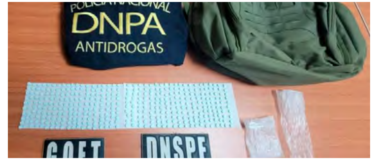
Las supuestas pastillas de metanfetamina fueron encontradas en una mochila.

POTRERILLOS. EL PARAÍSO. Agentes policiales detuvieron a tres personas, en posesión de pastillas de supuesta metanfetamina, en el punto de control fronterizo interno Las Crucitas, ubicado en esta localidad.