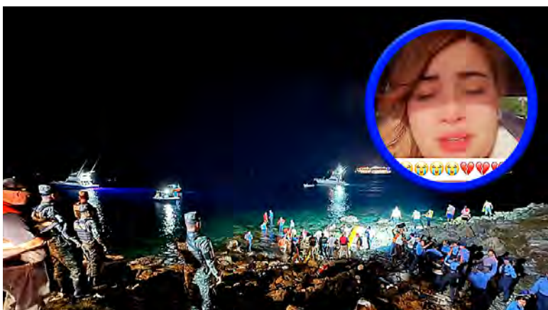
La hondureña radicada en Estados Unidos, dijo que Dios le había advertido en su sueño.

REDACCIÓN. El reciente trágico accidente aéreo ocurrido en Roatán, Islas de la Bahía, en el que fallecieron 12 pasajeros, generó conmoción en todo el país. En la cuenta personal de la red social Tik Tok, una dama identificada como "Celylovers" compartió un testimonio en el que asegura haber recibido una "revelación Divina" sobre la tragedia.