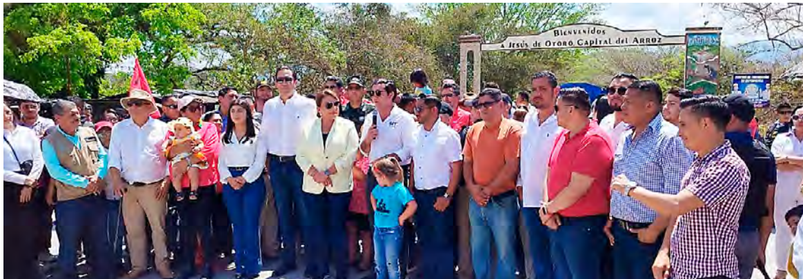
La titular del Poder Ejecutivo recorrió unos 15 kilómetros sobre la obra gris.

“A esta carretera solo le quedan unos 3.5 kilómetros y las obras complementarias como aceras, drenajes, bordillos de protección lateral, iluminación, señalización y estacionamiento de autobuses,