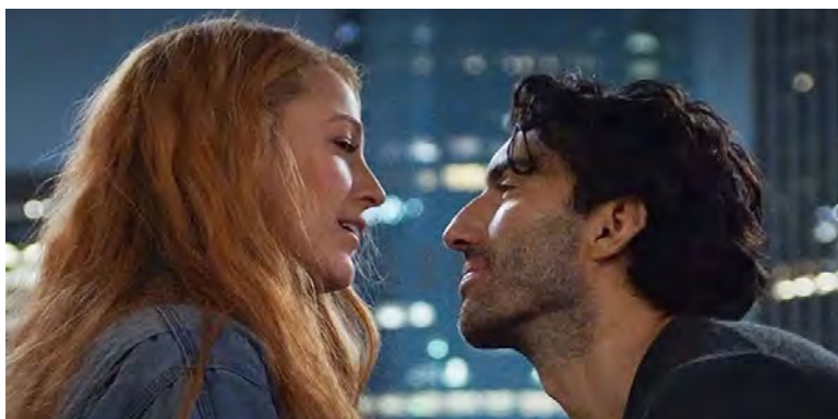
La actriz Blake Lively, junto al director Justin Baldoni.