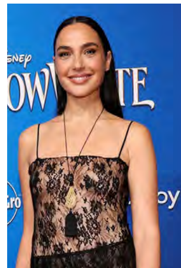
La actriz israelí, Gal Gadot.

ESTADOS UNIDOS. Gal Gadot ha optado por mantenerse al margen de las discusiones políticas mientras promociona su próxima película, la versión live-action de Blancanieves de Disney. En una entrevista con Variety, la estrella de Wonder Woman expresó su deseo de centrarse en su trabajo como artista en lugar de abordar temas políticos.