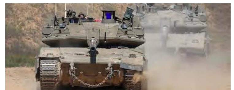
Tanques israelíes en la frontera con la Franja de Gaza.

FRANJA DE GAZA. El Ejército de Israel dijo haber iniciado operaciones terrestres "específicas" en la Franja de Gaza a fin de "crear una zona de amortiguación parcial", en lo que fuentes locales describieron como un bloqueo en la carretera Salah al Din, que conecta de norte a sur el enclave palestino.