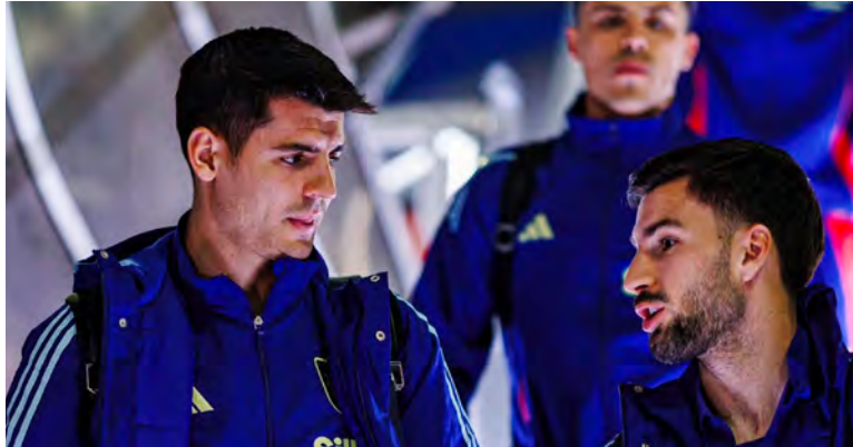
Alvaro Morata (derecha) es uno de los referentes del ataque español.

eliminación. Es un partido difícilísimo, durísimo, contra un rival con grandes jugadores. Este partido podría ser la final de una Eurocopa", estimó este miércoles en Róterdam el seleccionador español, Luis De la Fuente. Para confeccionar su lista, el técnico de los campeones de Europa se ha visto limitado por las lesiones.