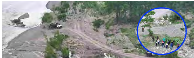
Las autoridades en el momento del operativo a orillas del río Cangrejal.

LA CEIBA. En el marco de la Resolución Cero Deforestación al 2029, la Policía Militar del Orden Público (PMOP), en conjunto con el Instituto de Conservación Forestal (ICF) y la Procuraduría General de la República, llevó a cabo un operativo en el sector de Casa Blanca y la colonia Los Bomberos, a orillas del río Cangrejal, en esta ciudad. Durante la intervención, las autoridades detectaron indicios de usurpación en un área de aproximadamente dos a tres hectáreas, den-