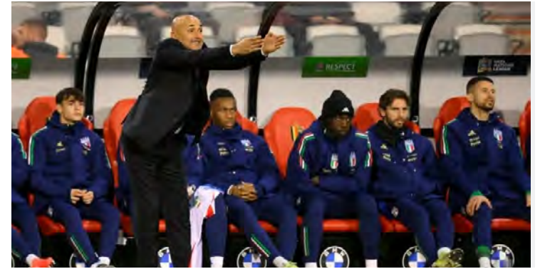
Spalletti durante el partido de Liga de las Naciones contra Bélgica.

REDACCIÓN. Ocho estrellas brillan entre los dos escudos: Italia y Alemania, que se enfrentan en cuartos de final de la Liga de las Naciones, confiaron, casi en el mismo momento, en Luciano Spalletti y Julian Nagelsmann para regresar a la élite del fútbol de selecciones.