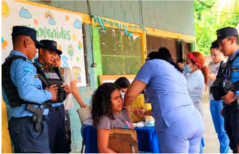
La presencia policial contribuyó a generar un ambiente de confianza y colaboración entre los asistentes.

CHOLOMA, CORTÉS. La Policía Nacional a través de Unidad Metropolitana de Prevención Número 10 (Umep-10), en su compromiso con el bienestar de la ciudadanía, brindó acompañamiento y seguridad a una brigada médica que se llevó a cabo en las escuelas Alfa y Omega y Augusto C. Coello en el Sector López Arellano, de esta ciudad. La iniciativa, coordinada con la Secretaría de Salud, tuvo como objetivo acercar servicios de atención médica a los habitantes de la zona.