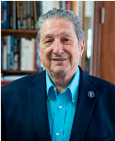
Por: Pedro Corzo Periodista X: @PedroCorzo43

Hay personas que por su obra de vida dejan huellas indelebles y entre esos rasgos que enorgullecen la posteridad, están los de Lincoln Díaz Balart, un hombre que honró el gentilicio de dos países durante toda su vida. Lincoln fue un hombre con grandes compromisos ciudadanos; responsabilidad que se puede apreciar a través de sus actividades en las que mostró sentirse obligado con Cuba y Estados Unidos por igual, pero más profundamente, con las personas que