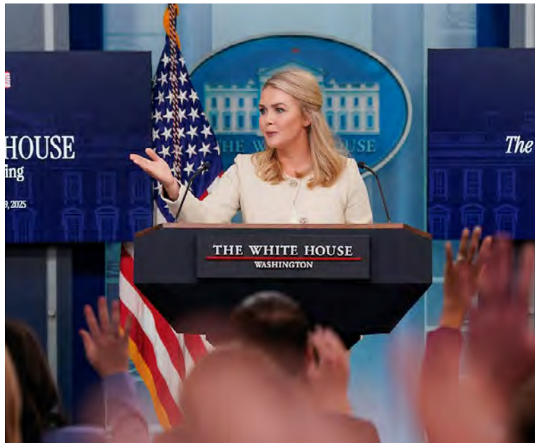
La portavoz de la Casa Blanca, Karoline Leavitt.

La portavoz de la Casa Blanca, Karoline Leavitt, aseguró en rueda de prensa que el uso de esa ley de 1798, que permite detenciones y expulsiones sumarias en caso de guerra o invasión del territorio, está justificada debido a que el Tren de Aragua está llevando a cabo una “incursión predatoria” de Estados Unidos. “Ha sido enviada aquí por el régimen hostil de Maduro en Venezuela y el presidente nada más asumir el cargo designó al TdA como organización terrorista, y bajo esta ley es la autoridad del presidente deportar a estos terroristas, o aquellos que defienden a estos terroristas, que han sido enviados a suelo estadounidense”, indicó la portavoz. Organizaciones como el Brennan Center for Justice han criticado el uso de la Ley de Enemigos Extranjeros, que no se usaba desde la II Guerra Mundial, porque está pensada para momentos en los que el país pasa por un conflicto bélico de-