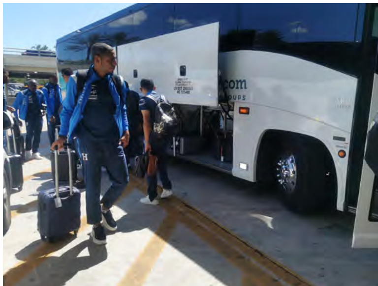
La "Bicolor" partió ayer a Bermudas, y hoy reconocerá el campo donde juega.

El equipo dirigido por Rueda continuó su preparación en Fort Lauderdale hasta el miércoles 19 de marzo, cuando viajó a Bermudas. Para esta serie de repechaje, Honduras contará con sus jugadores legionarios,