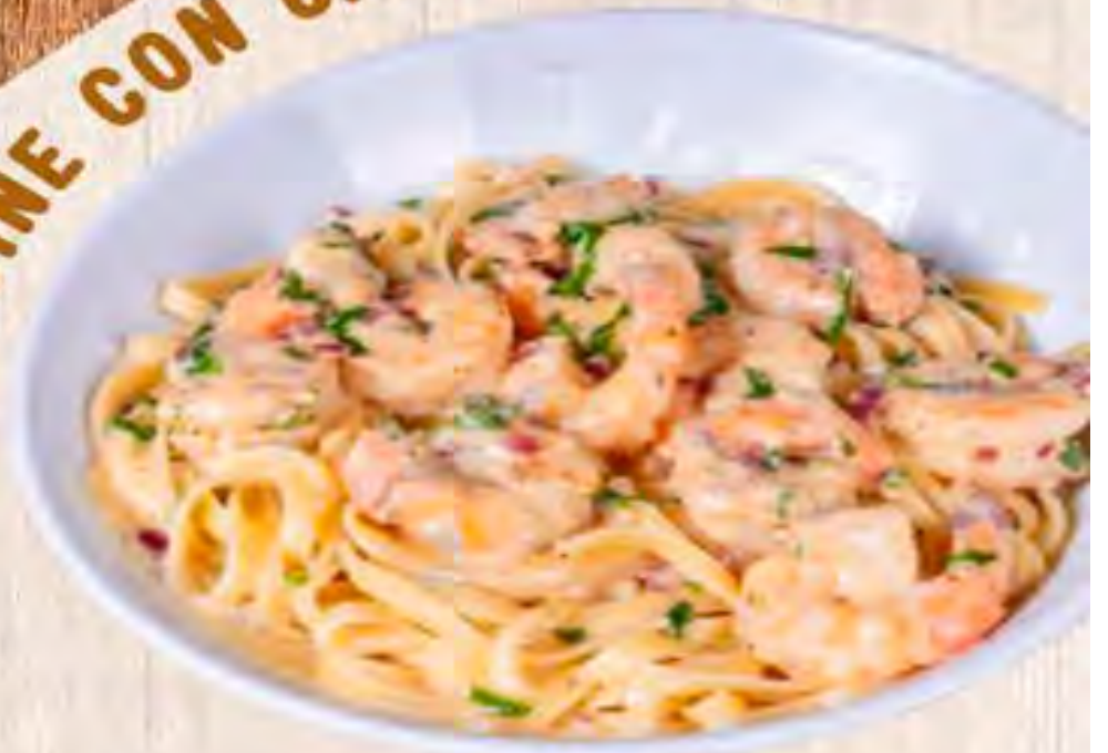
FETTUCINE CON CAMARONES