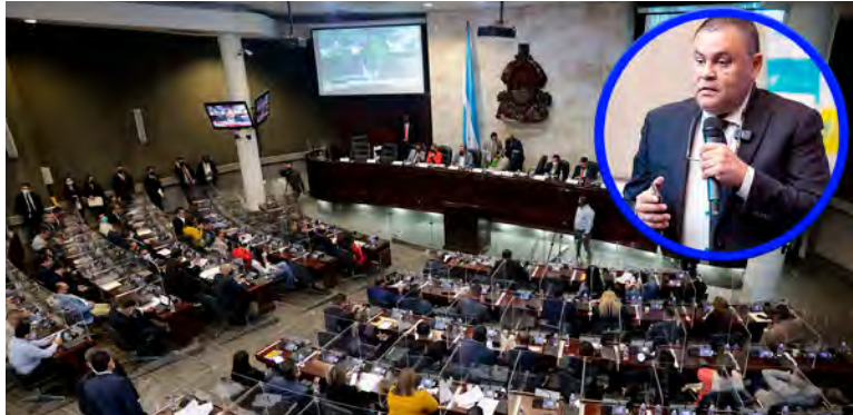
En las elecciones primarias fueron inscritos 93 diputados que buscarán la reelección.

"Siempre he dicho que este Congreso comenzó mal, ingobernable, ha habido poca capacidad de consenso, excepto en los temas que el tripartidismo se arropa en la impunidad, para eso si han sido campeones, se han podido elegir la Corte, el fiscal y todos los organismos, para eso si ha habido consensos, pero para legislar en favor del pueblo hondureño, pues ha sido de conflicto en conflicto, este año ya sabíamos que iba a ser eminentemente político", expresó.