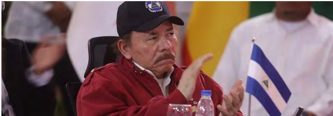
El presidente de Nicaragua, Daniel Ortega.

NICARAGUA. El Gobierno acusó a los países de la región Costa Rica, Guatemala, Panamá y República Dominicana de inmiscuirse en sus asuntos internos tras rechazar la candidatura del excanciller nicaragüense Denis Moncada como nuevo secretario general del Sistema de la Integración Centroamericana (SICA), según un texto oficial. En un comunicado, el Ejecutivo sandinista que preside Daniel Ortega junto con su esposa, Rosario Murillo, explicó que la tarde del martes se realizó un encuentro de Cancilleres del SICA para decidir sobre la terna que fue presentada de "manera responsable y oportuna por Nicaragua para ejercer la Secretaría General del SICA, que corresponde por derecho e institucionalidad del Sistema, al pueblo y