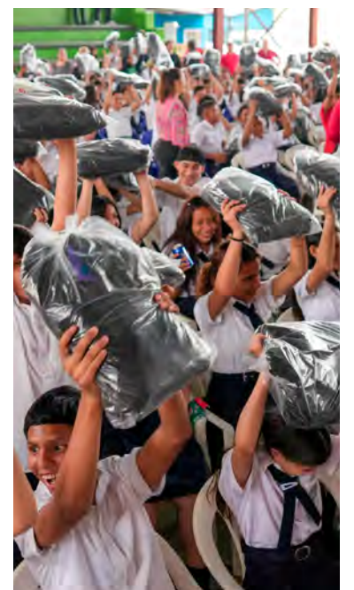
Los escolares se mostraron contentos con el aporte.