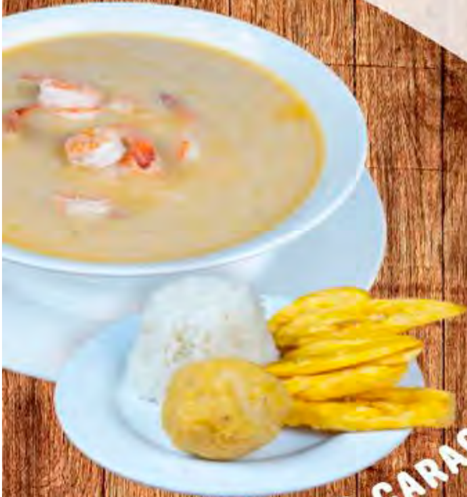
SOPA DE CARACOL