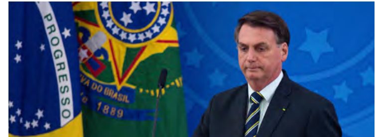
El expresidente de Brasil Jair Bolsonaro.

BRASIL. La mayoría del Supremo Tribunal Federal (STF) rechazó los recursos presentados por el expresidente Jair Bolsonaro para tratar de apartar a dos jueces en el marco del proceso en el que está acusado de liderar una trama golpista contra el Gobierno de Luiz Inácio Lula da Silva. El presidente del STF, Luiz Roberto Barroso, que es instructor en el juicio, rechazó la petición de Bolsonaro de recusar a dos de los magistrados y la mayoría de los jueces de la alta corte votaron en el mismo sentido,