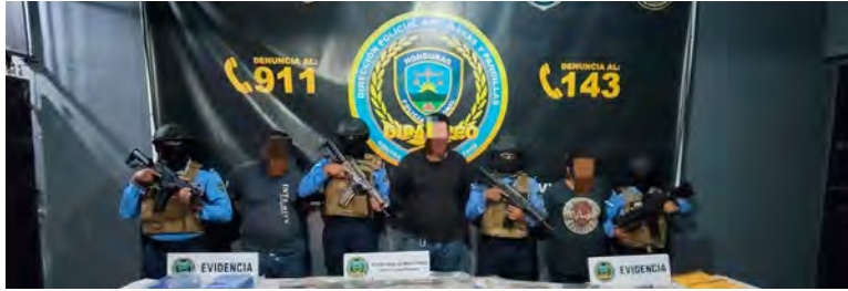
Los detenidos junto con la evidencia fueron presentados ante las autoridades correspondientes.