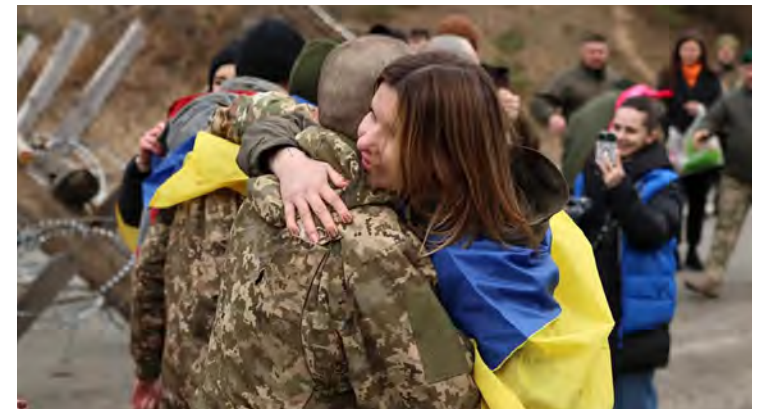
Prisioneros liberados se reencuentran con sus familiares.