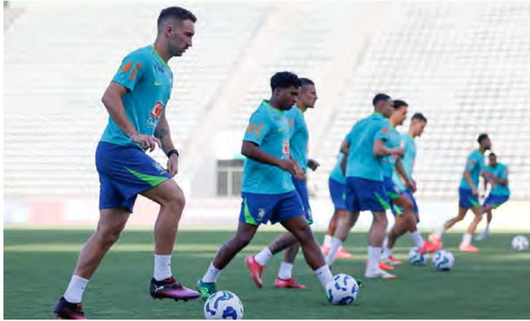
Brasil está en manos de "Raphinha" y Vinicius, estrellas de LaLiga española.

La presión sobre el entrenador de 62 años luce asfixiante, especialmente luego de que el presidente de la Confederación Brasileña de Fútbol (CBF) trazó un objetivo claro para los primeros juegos de 2025.