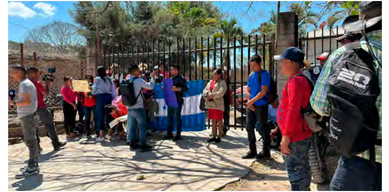
Padres de familia de un centro educativo exigen maestros.

GRACIAS, LEMPIRA. La Dirección Departamental de Educación de Lempira, fue tomada por un grupo de personas, debido a que se les ha retirado tres plazas del tercer nivel en un Centro de Educación Básica, de la comunidad de Tenango, en el municipio de Gualcince.