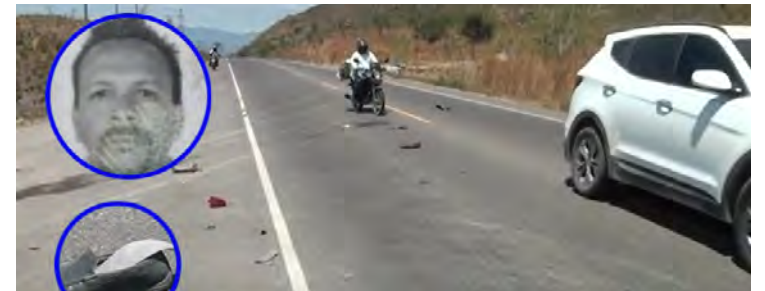
El catedrático murió cuando se transportaba a su centro de trabajo.

CHOLUTECA, CHOLUTECA. Un docente falleció, luego que un carro impactara contra su motocicleta, en la carretera hacia la frontera de Guasaule, cerca de la comunidad Posta Vieja, ubicada en este municipio.