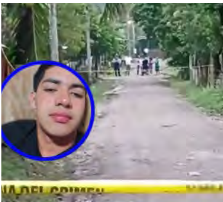
El joven quedó tirado en las afueras de una vivienda.

Asimismo, las autoridades, solicitaron a la ciudadanía que, si tiene información de los responsables de este crimen, pueda interponer la denuncia al Sistema Nacional de Emergencia 911 o abocarse a sus oficinas.