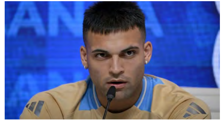
A la ausencia de Messi en Argentina, se suma la de Lautaro Martínez.

ITALIA. El delantero Lautaro Martínez (Inter de Milán) quedó fuera de la convocatoria de la Selección Argentina para los partidos contra Uruguay y Brasil, por la eliminatoria sudamericana para el Mundial de 2026, debido a una lesión muscular.