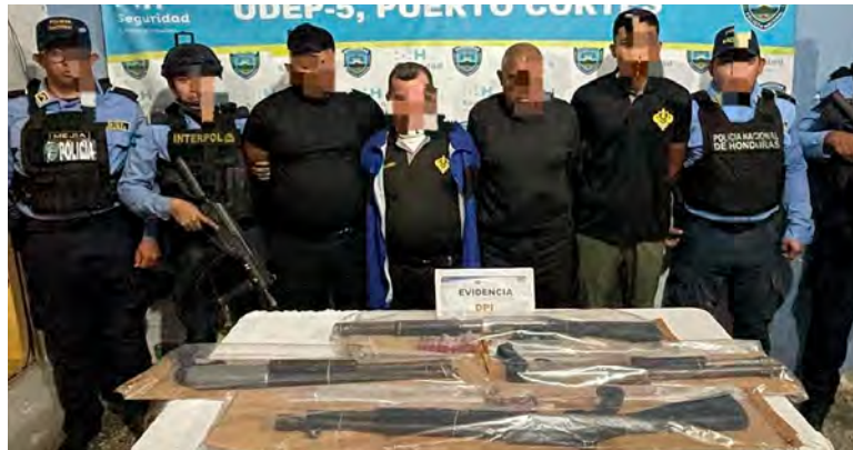
Los arrestados fueron remitidos ante las autoridades correspondientes.

Los cuatro arrestados son residentes, de esta localidad, con edades de 24, 26, 60 y 68 años, respectivamente, quienes fueron remitidos a la Fiscalía de Turno del Ministerio Público, señalados por el delito antes mencionado. Cuando se efectuó su arresto, les decomisaron cuatro escopetas, que no tenían el regis-